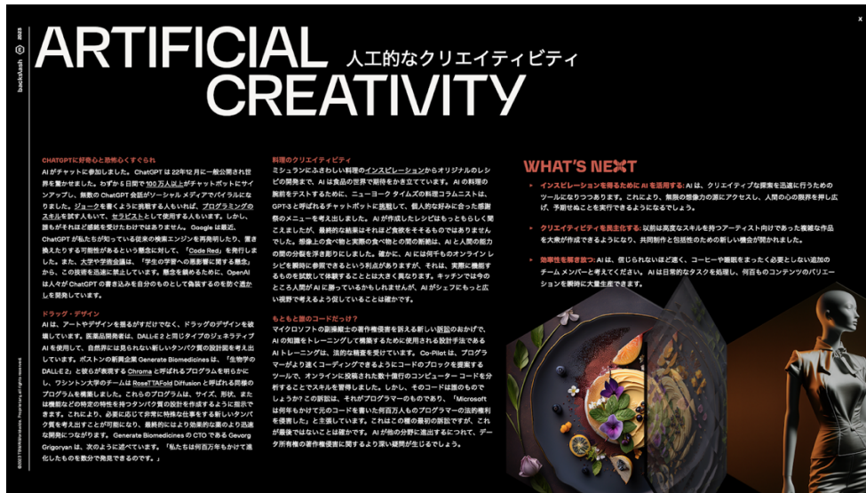
3 ページ目：エッジの詳細（象徴的な世界の事例）＋未来への提言

このようなエッジが 39 点、それぞれ 3 ページずつ本紙では紹介されています。全 127 ページのレポートが無料でダウンロードできますので、ぜひご利用ください。