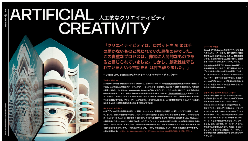
2 ページ目：エッジの詳細（象徴的な世界の事例）