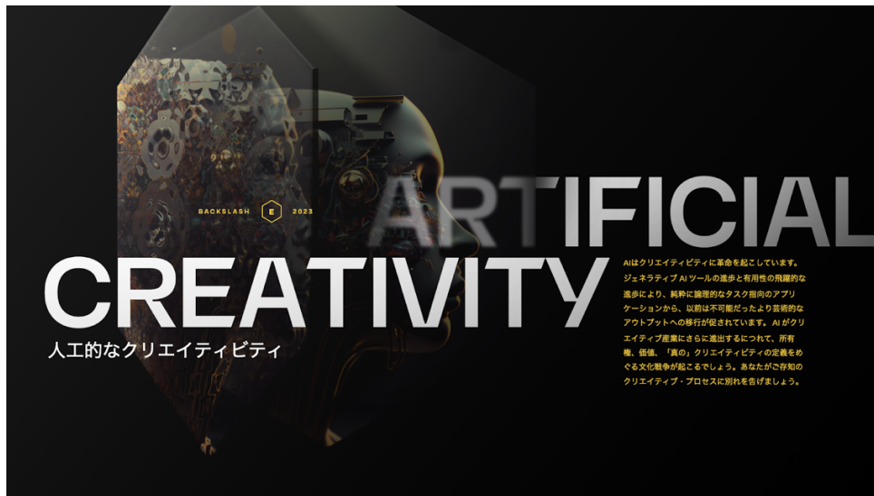
1 ページ目：エッジの概要

たとえば、今年新たに追加されたエッジのひとつ「ARTIFICIAL CREATIVITY（人工的なクリエイティビティ）」では、3 ページに渡って AI ツールの進化により生まれた新たなビジネスや社会運動、識者のコメントなどと共にこうした出来事に通底する時代の価値観（エッジ）の考察が描かれています。