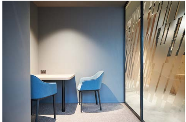
個人で集中して作業ができるスペース、1on1に適したミーティングルーム