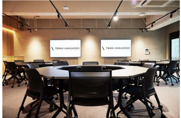
カフェラウンジとワークショップスペース (Disruption Room)