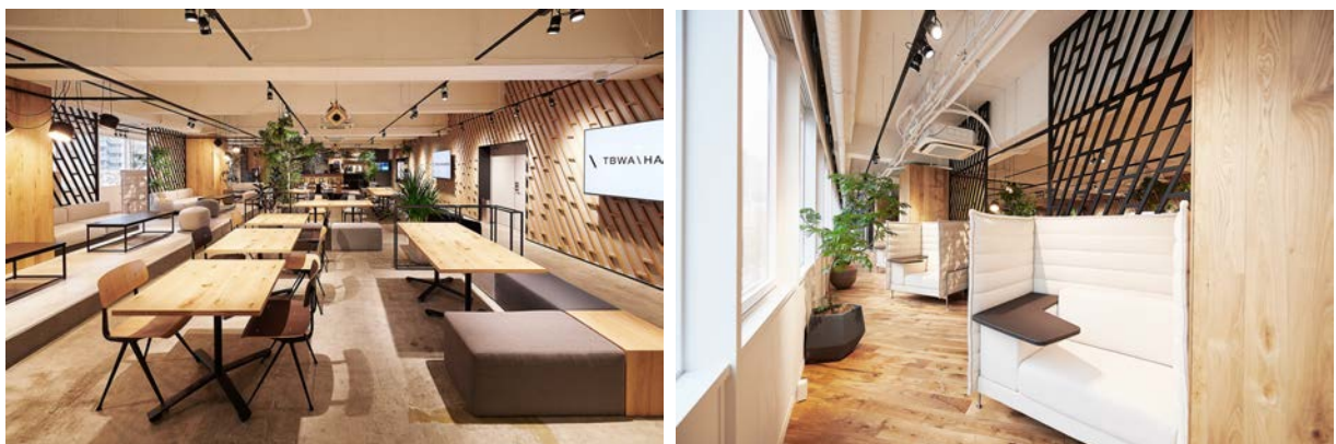
個人の自由な発想を促す共有エリア

社員のコミュニケーションやリフレッシュを促すラウンジ・カフェなどの共有スペース、新しいアイデアを引き出し膨らませることのできるワークショップスペースやライブラリー、大小さまざまなミーティングルーム、個人集中スペース、対話を促進する 1on1 ルームなど、多種多様なニーズに合わせた空間が用意されています。