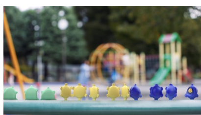
いろんなものに手を触れる子どもの手

YouTube URL : https://youtu.be/ICyYM2qMobk