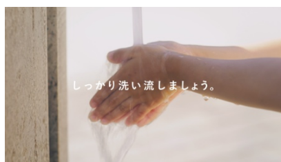
しっかり洗い流しましょう。