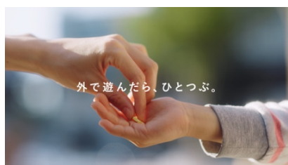
外で遊んだら、ひとつづ。