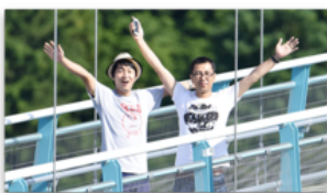
バストアップの写真から

https://www.youtube.com/watch?v=AxNrcFR7iS4