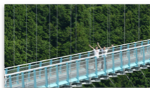
徐々に映像が引いていき