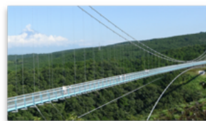
背景の美しい景色が映し出される