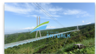
動画の最後に企業ロゴ/サービスの静止画が映し出される